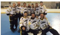
COPPA ITALIA, L'ASIAGO...