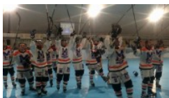
SERIE A, 2ª GIORNATA: RISULTATI...