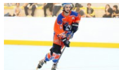
LA COPPA ITALIA PARTE CON...