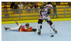
SERIE A, 2ª GIORNATA: IL...