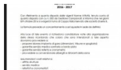
TDR E COPPA ITALIA, BANDI