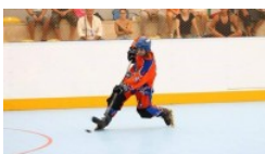
RAVI MFCRCI IRI VOI A IN