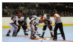
SERIE A 1^ GIORNATA-