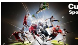
JERSEY53, SBARCA IN ITALIA...