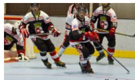
SERIE A, 3ª GIORNATA: IL...