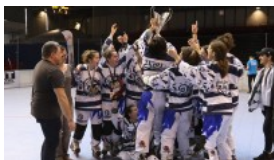
EUROPEAN LEAGUE FEMMINILE,...