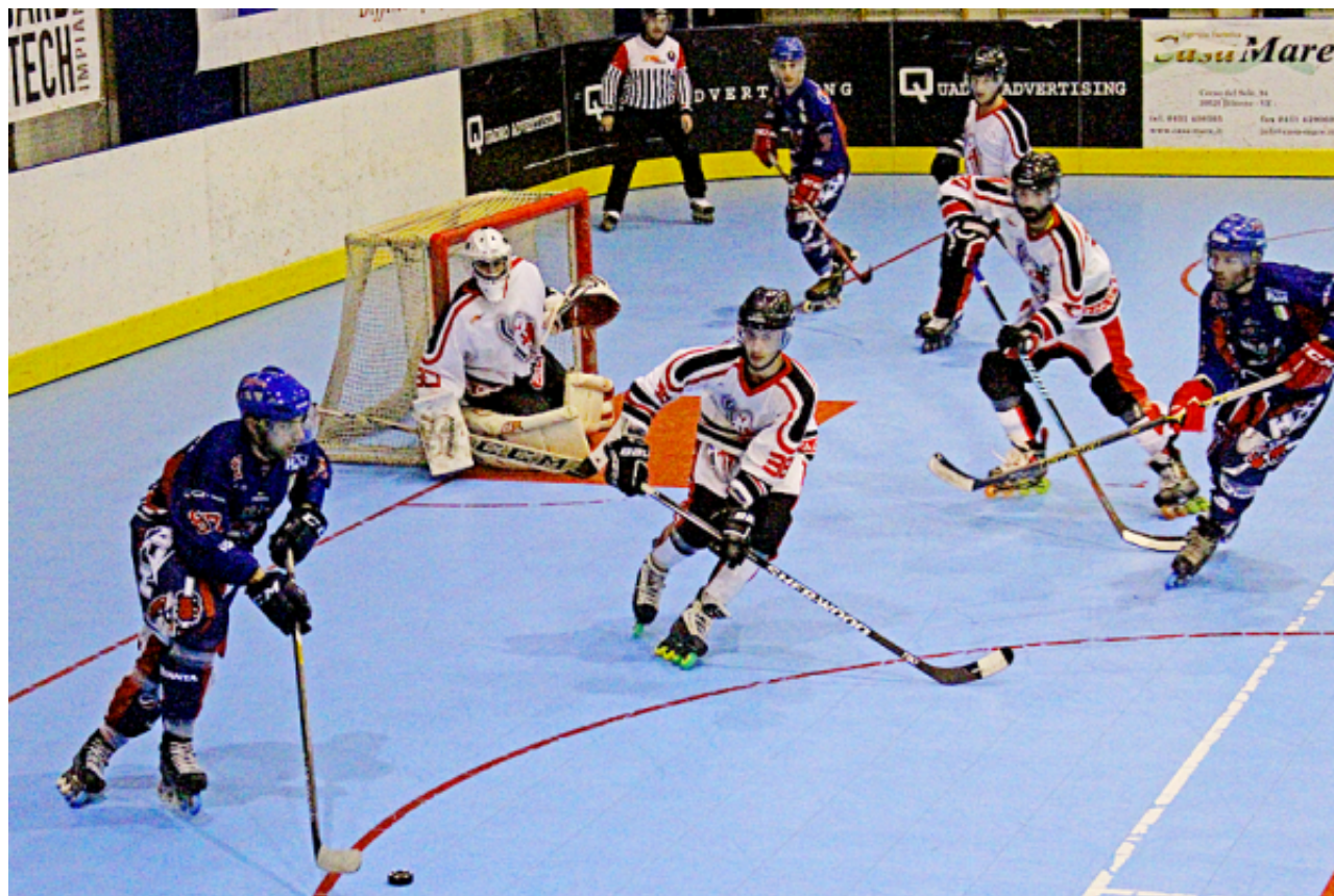
HC Milano Quanta

MILANO - Grazie al successo in trasferta l' HC Milano Quanta si qualifica per la semifinale del campionato italiano hockey in line serie A1 con una giornata di anticipo. Era fondamentale chiudere la serie con gara 2, per evitare la "bella" , così è stato. Ai rossoblu il merito di aver archiviato la pratica con un bel 7-4, ribaltando lo svantaggio rimediato a metà primo tempo con i meneghini sotto di 2 reti.